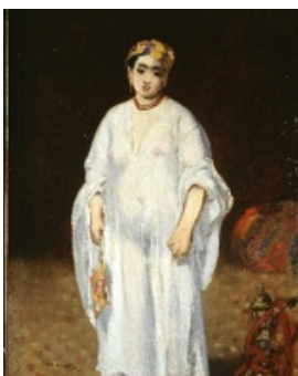
Edouard Manet La Sultane , um 1871 Öl auf Leinwand; aus dem Besitz von Max Silberberg .

Aus heutiger Quellenlage gibt es keine Veranlassung, weitere Werke in der Sammlung der Stiftung aufgrund der neuen "Best Practices" als NS-verfolgungsbedingt entzogen und ungerügt einzuschätzen. Selbstverständlich wird die Stiftung jederzeit neue Erkenntnisse prüfen, die sich aus bisher unzugänglichen oder unentdeckten Quellen ergeben und wird bei Bedarf und in Absprache mit dem Kunsthaus Zürich Neubeurteilungen vornehmen.