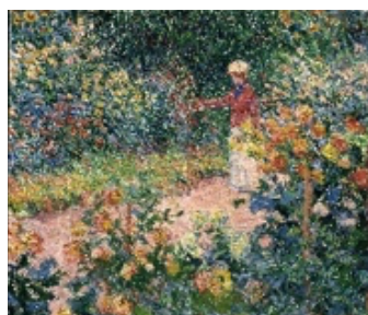
Claude Monet Jardin de Monet à Giverny, 1895 Öl auf Leinwand