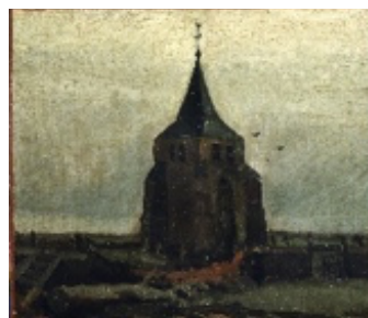
Vincent van Gogh Der alte Turm, 1884 Öl auf Leinwand